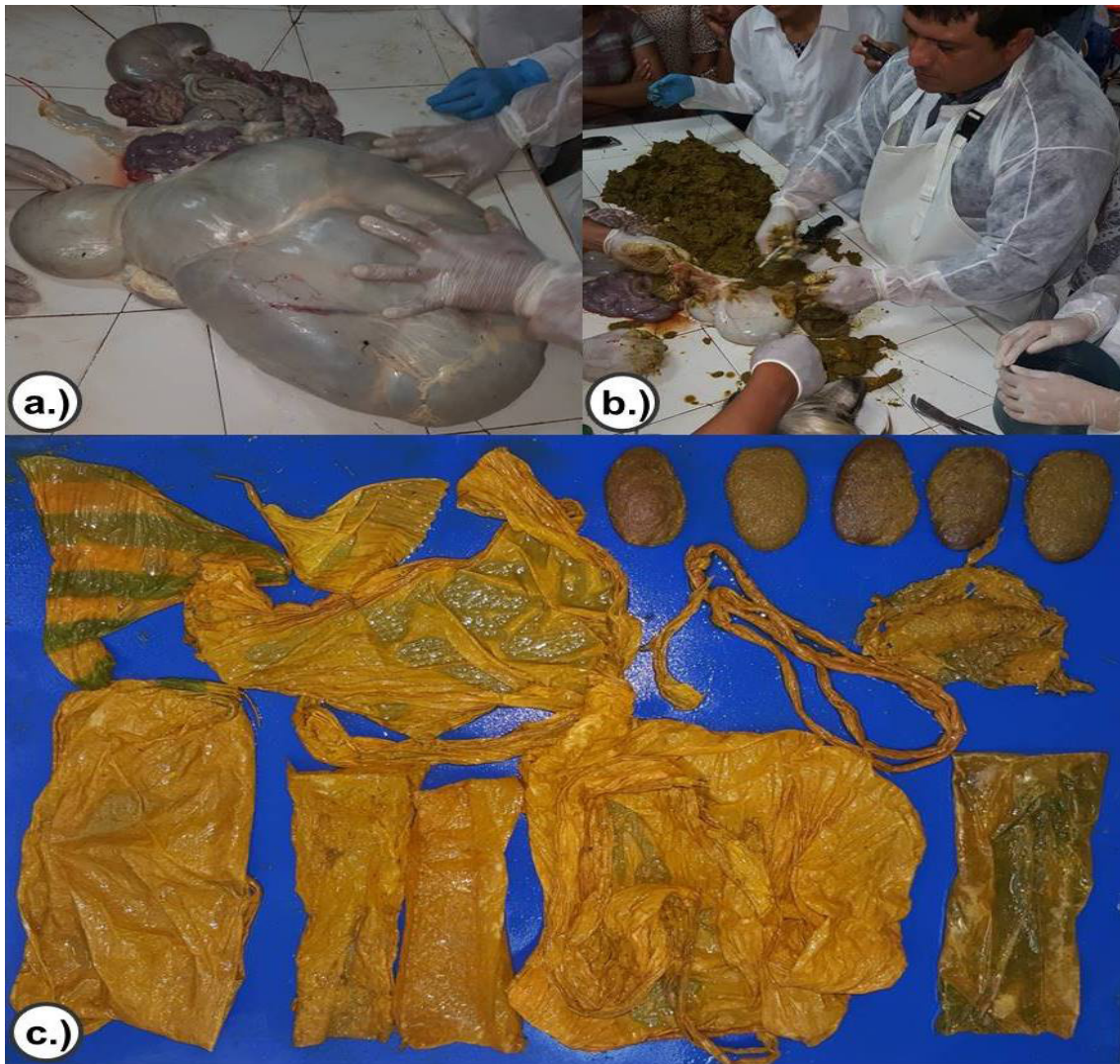
Figura 2. Procedimiento de necropsia. a.) Pre-estómagos con aumento considerable de tamaño. b.) Proceso de disección de rumen. c.) Grandes cantidades de bolsas de plástico y semillas de mango ( Mangifera spp).