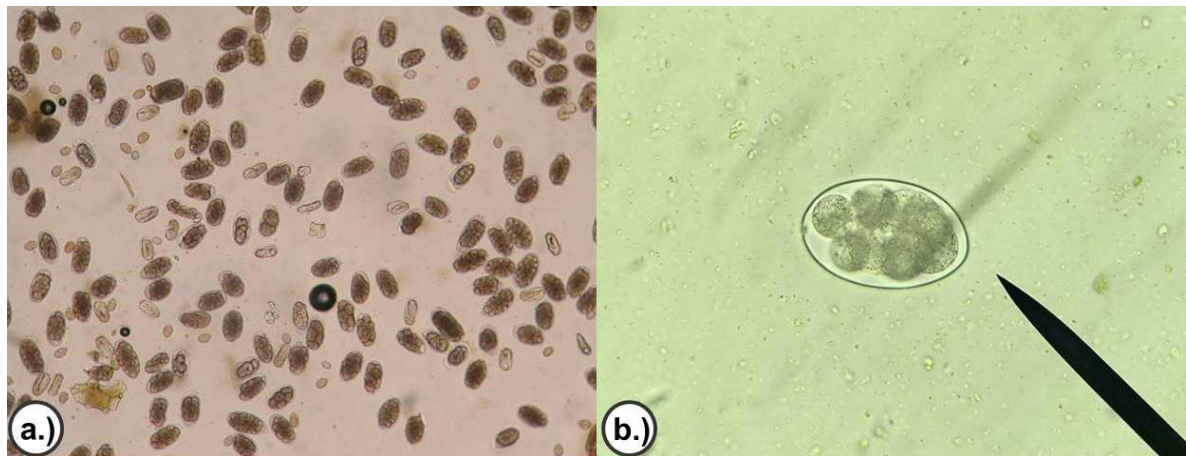
Figura 4. Huevos de Haemonchus contortus observados en el microscopio. a.) a 10x y b.) a 20x.