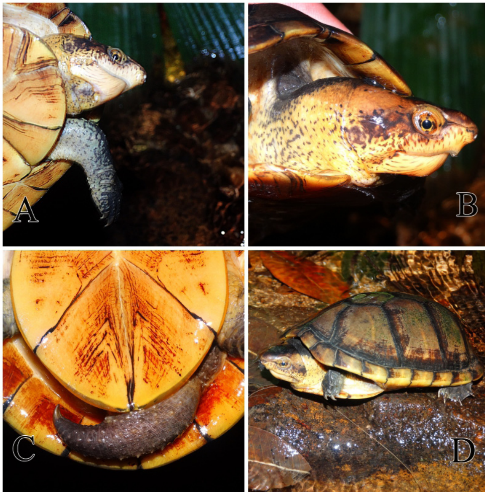
Figura 2. A y B) Viste ventral y lateral de la cabeza; C) Cola del ejemplar macho; D) Vista lateral del cuerpo.

Agradecimientos: A nuestros amigos Nelly Moreno, Mónica Ospina, Patrimonio Natural por permitir la visita a el área de estudio y a los habitantes y amigos de la vereda "Las Margaritas" por su colaboración en campo y por abrirnos las puertas de sus hogares durante el trabajo de campo.