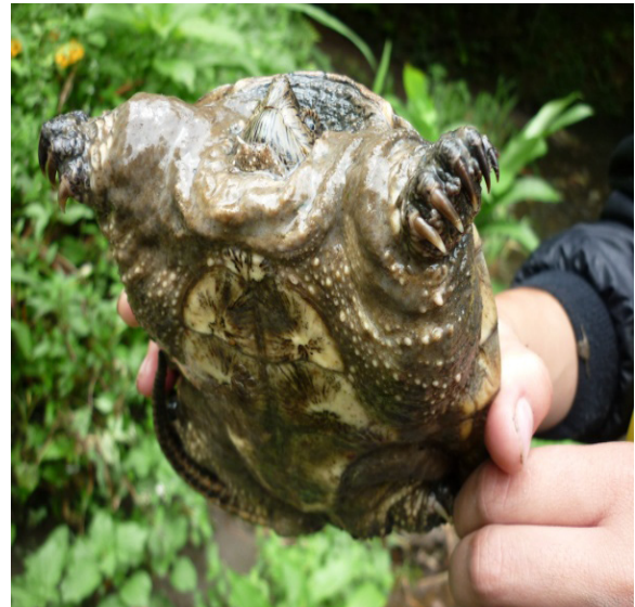
Figura 4. Tortuga juvenil con aparente infección cutánea y edema generalizado (Quebrada Cajones)

tolerancia a la carga de contaminantes provocaba un desequilibrio en los niveles de estrógeno y testosterona y que la acumulación de cargas contaminantes afectaba el desarrollo de los huevos.