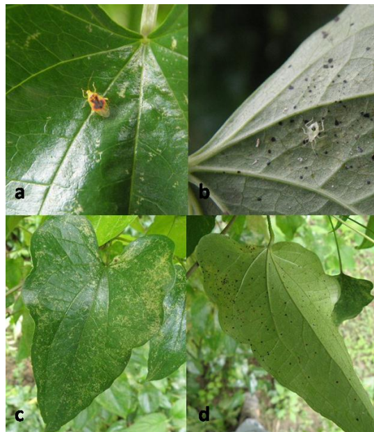
Figura 2. Parafurius discifer a. adulto, b. ninfa y síntomas causados en c. haz y d. envés de las hojas de ñame

Este trabajo permite advertir que el ñame es un hospedero de P. discifer y aporta datos de la distribución geográfica de este mírido en Colombia. Sin embargo es importante señalar que hasta el momento no parece constituir una plaga de importancia económica en estos cultivos.