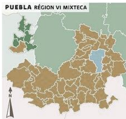
Figura 1. Mapa del estado de Puebla y ubicación de la región mixteca.

La región de la Mixteca, se ubica al sur del estado de Puebla (Fig. 1), en ella residen aproximadamente 200 mil 419 habitantes dispersos en 754 localidades (PRODEFOR, 2006), el municipio de Piaxtla, se localiza en la parte suroeste del estado de Puebla; ubicándose geográficamente en los paralelos 17°59'00" y 18° 12'30" de latitud norte y los meridianos 98°10'54" y 98°21'36" de longitud occidental y su altitud oscila entre los 700 y 2.000 msnm (INEGI, 2000).