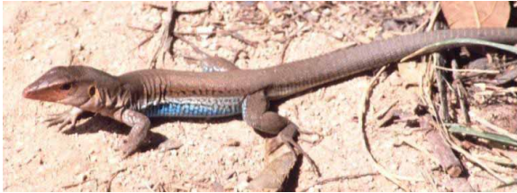
Figura 1. Ameiva auberi (Fuente, Libro Anfibios y Reptiles de Cuba 2003, Rodríguez Schettino, L., ed.).

tarjeta y hojas de datos). De las 28 subespecies descritas para Cuba, 25 están presentes en la colección herpetológica del IES básica y las otras tres en la de tipos. El número de ejemplares por subespecies no es homogéneo (Tabla 1), lo que se corresponde con la distribución referida en la literatura. La de mayor número de ejemplares es A. a. auberi y la de menor, A. a. paulsoni sin tener en cuenta las tres que solo se encuentran en los tipos.