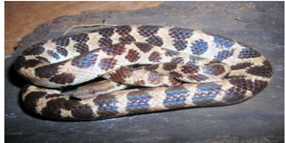
Figura 3. T. spiritus