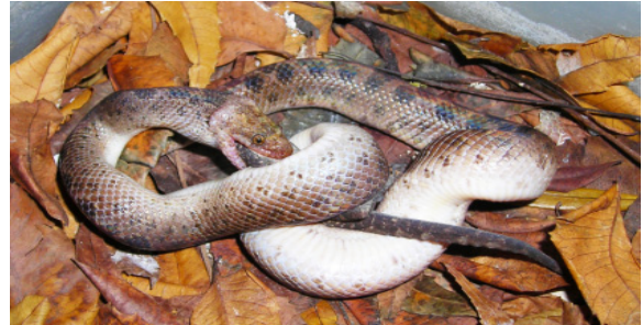
Figura 1. T. celiae

La información sobre las especies de este género se encuentra dispersa en numerosas publicaciones seriadas y libros. Por ello, el objetivo de este trabajo es compilar los datos sobre la distribución geográfica y relacionar esta con las áreas protegidas del país, para verificar cuáles especies del género Tropidophis se encuentran cubiertas por el Sistema Nacional de