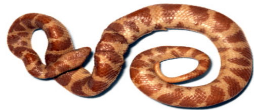
Figura 2. T. morenoi