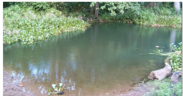
Figura 2. Localidad de muestreo Chalons 2.

Caracterización de las áreas de estudio: La primera localidad fue nombrada Chalons 1, ubicada en los 75° 48' 49"W y 20° 4' 12"N de coordenadas a 82 m snm, está a 50 m de la cortina de agua, junto al primer muro del aliviadero. En un área de 15 por 10 m 2 . La vegetación acuática está formada principalmente por E. crassipes , que ocupa el 90% del área. También aparecen las especies Typha dominguensis , Salvinia hispida y en las orillas Cyperus rotundus . El fondo es fangoso con abundante detritus y profundidad máxima de 0,8 m. Presenta pocos árboles y arbustos a su alrededor, permitiendo la incidencia los rayos solares directamente sobre el área a determinada hora del día.