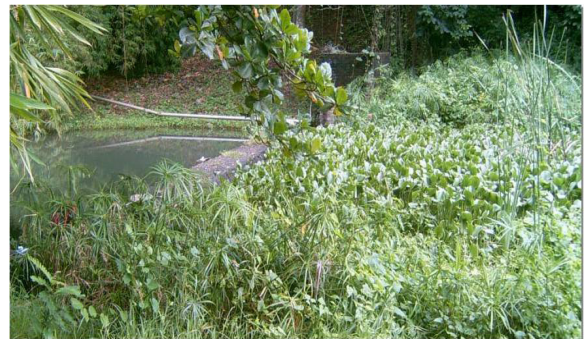
Figura 1. Localidad de muestreo Chalons 1.

El presente estudio se realizó desde marzo de 2005 hasta marzo de 2006, en dos localidades del aliviadero de la represa Chalons, construida entre 1904 y 1906, al norte de la ciudad de Santiago de Cuba, en el km 6 1/2 de la Carretera Central (Figs. 1 y 2).