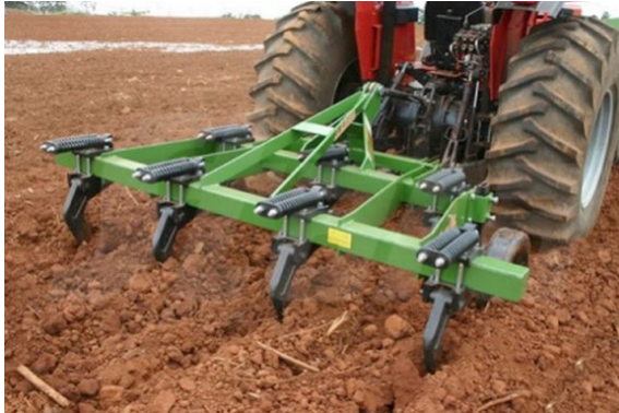
Figura 4. Subsolador montado en un tractor, usado para romper capas compactadas.

Remediaciones por métodos biológicos: El método principal de restauración de la porosidad de las capas limitantes del crecimiento de las raíces es utilizar las raíces de la vegetación natural o de cultivos de cobertura plantados para actuar como subsoladores biológicos que penetren en los horizontes densos. La estabilidad de los canales creados por las raíces de las plantas será mayor que aquella de canales formados por métodos mecánicos, ya que la liberación de sustancias orgánicas de las raíces estabiliza las superficies internas de los canales. Una vez que las raíces se han muerto y contraído, estos poros serán lo suficientemente grandes y estables para permitir que penetren las raíces del cultivo siguiente.