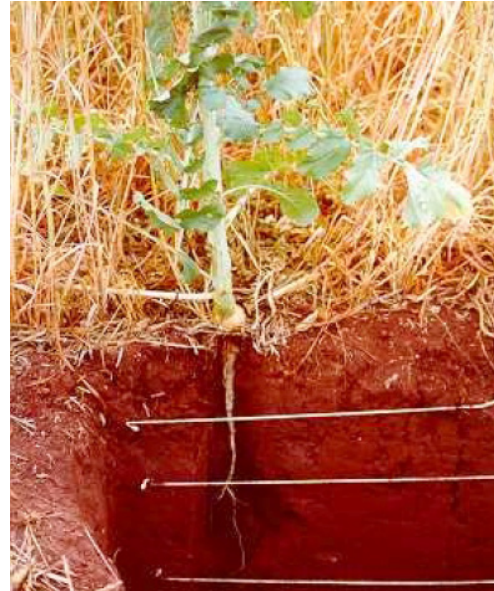
Figura 5. Ejemplo de una raíz muy visible de rábano penetrando en el suelo. El tamaño de la raíz principal indica lo beneficioso del rábano como «herramienta» biológica de descompactación. Cuando se practica la AC, esta raíz descompuesta dejará un bioporo en el suelo a través del cual el agua de lluvia podrá fácilmente infiltrarse. A. Calegari. Fuente: URL: http://www.fao.org/ag/ca/Training_Materials/CD27-Spanish/se/soil_assessment.pdf .

El rábano forrajero ( Raphanus sativus ) y los arbustos fijadores de nitrógeno Tephrosia vogelii , Sesbania sesban y Gliricidia sepium han sido también identificados como potencialmente útiles. Algunas malezas con raíces principales fuertes, como Amaranthus spp., pueden tener potencial para actuar como subsoladores biológicos, como han observado los agricultores Mennonitas de Bolivia que encontraron rendimientos más altos en suelos compactados después de infestaciones fuertes de Amaranthus spp. (Fig. 5).