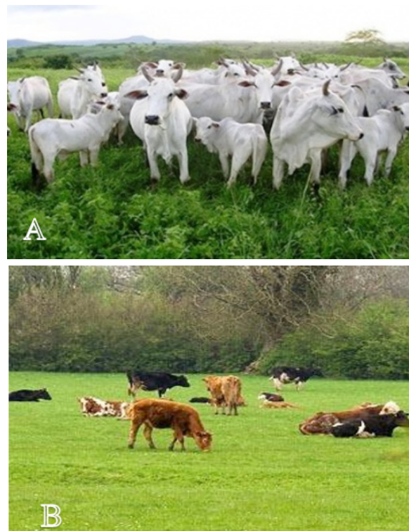
Figura 2. Tipos posibles de Ganadería (A. Intensiva, B. Extensiva.). Fuente: URL: http://www.contextoganadero.com/blog/ganaderia-intensiva-vs-ganaderia-extensiva/ ; B.

Respuesta del suelo al tránsito animal: La respuesta del suelo al tránsito por animales depende del contenido hídrico que posee cuando es pastoreado. Esta influencia del pisoteo es principalmente de tipo físico-mecánico, pues afecta el estado de compactación de los primeros centímetros del suelo. Cuando el suelo está más seco, el tránsito y pisoteo causan compactación del suelo, asociada con una pérdida de macroporosidad. La compactación deja escasa evidencia visual de su daño (Fig. 2). En cambio, el pastoreo en altas condiciones de humedad edáfica, da lugar a la ocurrencia de daño por “poaching”. Este daño es causado por el flujo de suelo alrededor de la pezuña del animal, dejando una huella bien definida, o en condiciones de extrema humedad, un suelo totalmente amasado.