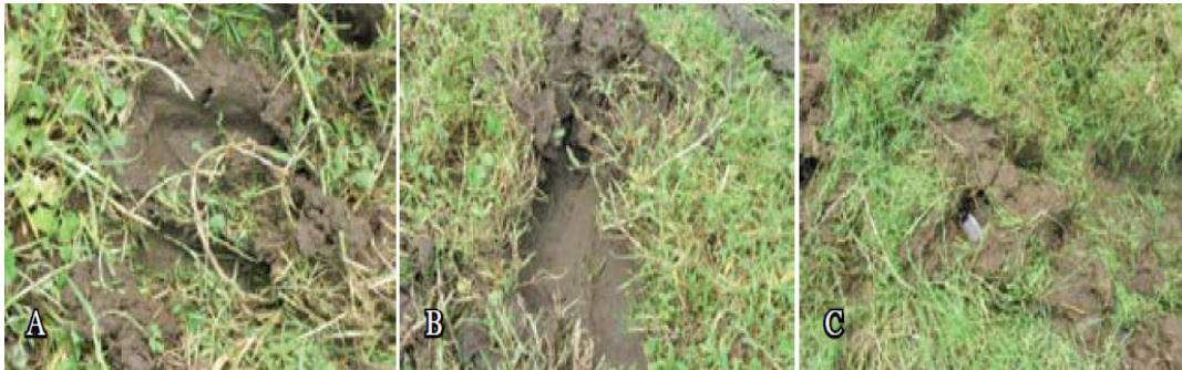
Figura 1. Efecto inmediato del pisoteo del ganado en la superficie del suelo con cobertura permanente de pasto kikuyo ( Pennisetum clandestinum ) (A. Huella de la pisada, B. Deslizamiento de la pisada y C. Acumulación de agua en área de pisoteo). Coronado, San José, Costa Rica.2008.