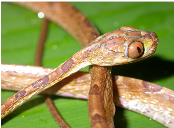
Figura 1. Especimen en vida de I. chocoensis (UTCH: COLZOOCH-H 0275), colectado en el corregimiento de Pacurita, municipio de Quibdó. Chocó-Colombia (5°40'31.40" N, 76°37'15.09" W, 53 m).

Producto de la revisión del material se determinaron cuatro especies del género Imantodes para el departamento del Chocó: I. cenchoa , I. inornatus , I. lentiferus e I. chocoensis , esta última objeto de estudio en esta investigación (Fig. 1), basada en dos especímenes identificados con número de colección UTCH: COLZOOCH-H 0275, UTCH: COLZOOCH 0318, que habían sido previamente asignados a I. cenchoa e I. inornatus respectivamente.